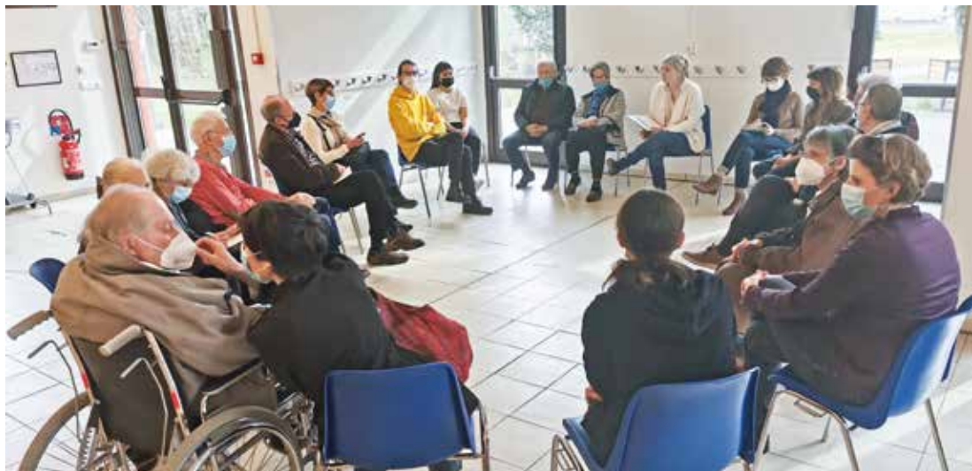
La réunion des aidants mise en place par quatre jeunes en services civiques employés par la Ville

Le projet de café des aidants est destiné aux personnes qui s’occupent d’un proche en perte d’autonomie à cause du vieillissement. “Ce sont des personnes qui donnent beaucoup de leur temps mais qui n’en ont pas beaucoup pour respirer. Le projet consiste à mettre en place une structure d’accueil pour leur permettre de souffler un peu” , explique Alexia au sortir de la première rencontre organisée à la MSF. Jusqu’à présent on a fait beaucoup de dé-