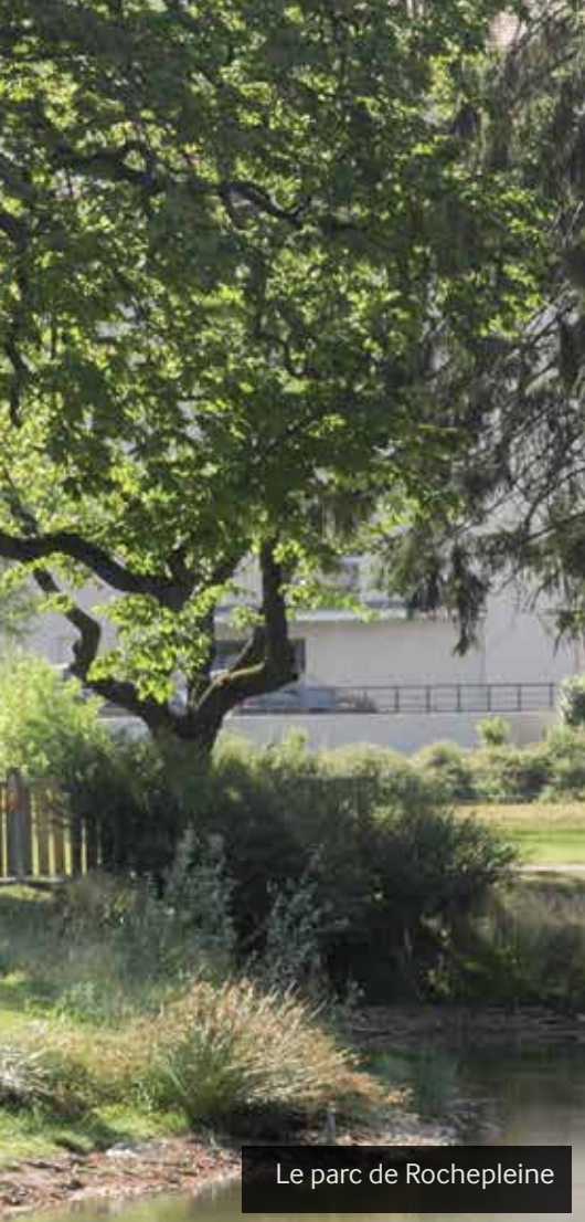
Le parc de Rochepleine

pose toute une série de rendez-vous mis en place aussi bien par des collectivités comme Saint-Égrève (voir pages suivantes) mais aussi par des entreprises et même par des particuliers. Dénominateur commun de toutes ces dates : la préservation de l'environnement au sens large du thème !