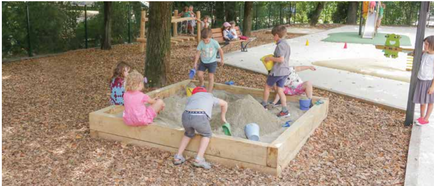
Après Barnave en 2021, c'est cette année au tour des cours du groupe scolaire de la Gare et de L'Unisson d'être entièrement repensées pour devenir pleinement des espaces à vivre